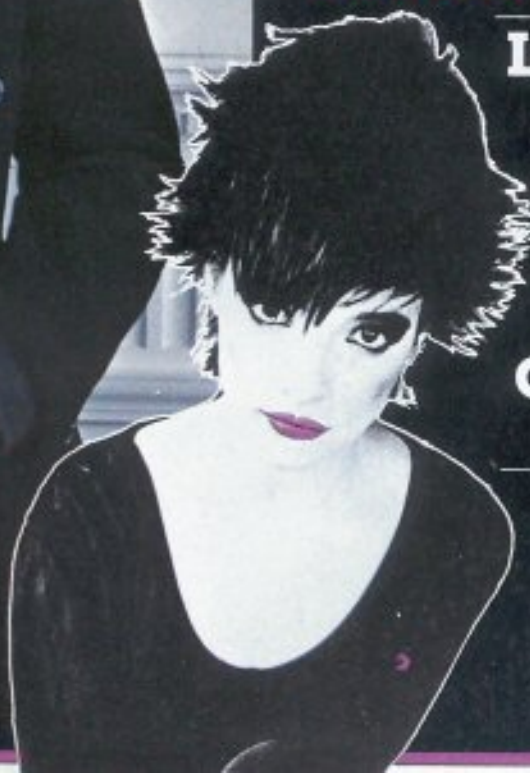
Nina Hagen Band